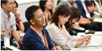
2019年9月に開催したファンドレイジング・カンファレンス「FRJ2019」にて