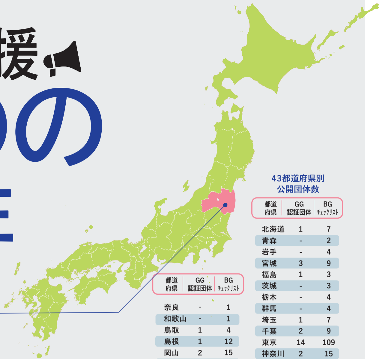
43都道府県別 公開団体数